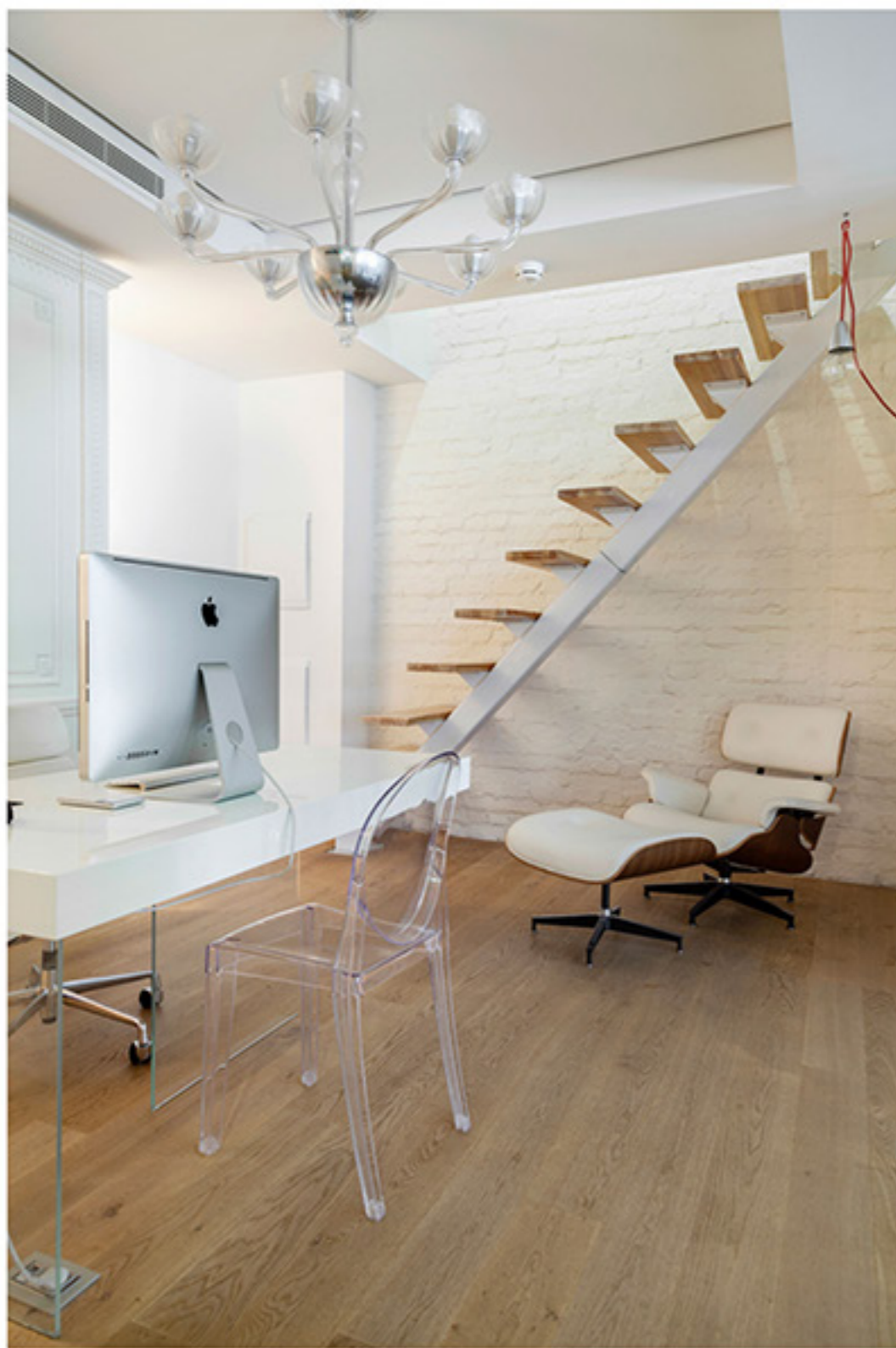
Журнальный столик AD дизайнеры придумали сами. Ножкой стеклянной столешнице служат несколько десятков номеров журнала, набор которых регулярно обновляется.