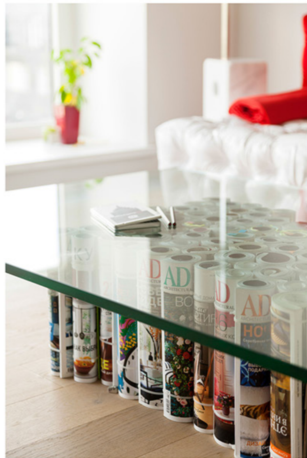
Взять полистать любой номер AD и вложить его обратно под столешницу или добавить к подшивке пару свежих выпусков можно в любой момент.